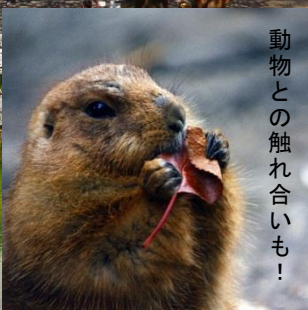
動物との触れ合いも!