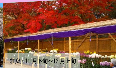
紅葉・11月下旬～12月上旬