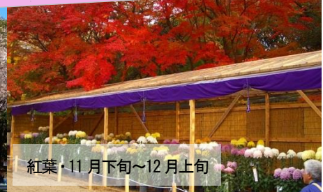
紅葉・11月下旬~12月上旬